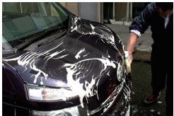
よく泡立たせ洗車します