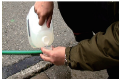
撥ッスルを50~100倍に 希釈になるよう混ぜます