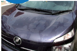
施工前の撥水状態