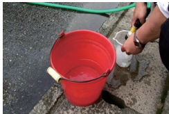
バケツに水を入れます